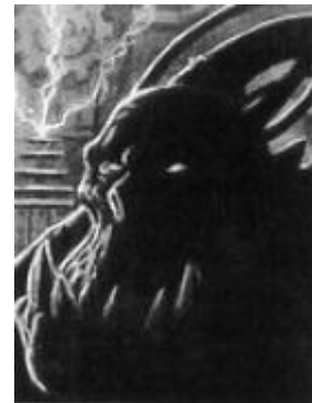
Une rare image d'Orkimesedes

Certains engins de guerre Orks possèdent des champs énergétiques. Le nombre dont en dispose chaque engin est indiqué sur sa fiche d'unité. Les champs énergétiques fonctionnent de la même manière que les boucliers du vide de l'Imperium, à la différence qu'une fois abattus ils ne sont pas réparables et restent donc inactifs jusqu'à la fin de la bataille.