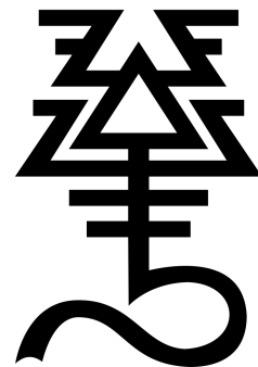
Rune du "Dieu aux mains sanglantes"

Seuls les Rangers et les Marcheurs de Combat peuvent se déployer en garnison .