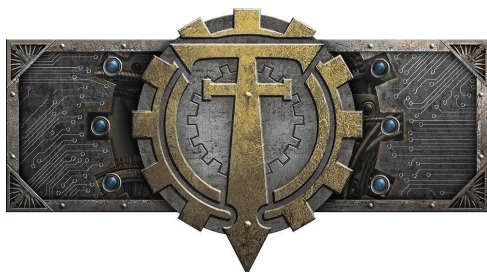
Emblème du Collegia Titanica.

Chaque formation peut recevoir des améliorations . La liste d'armée indique pour chaque formation quelle amélioration est autorisée. Chaque amélioration autorisée ne peut être prise qu'une fois par formation pour un maximum de quatre par détachement . Les améliorations font partie intégrante des formations et doivent respecter les règles de cohésion.