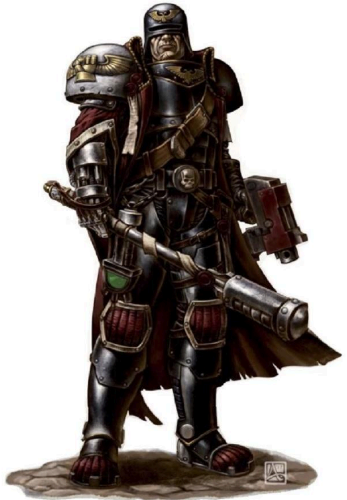
Arbitrator de l'Adeptus Arbites.

Les troupes de l'Adeptus Arbites sont des troupes d'élites chargées du maintien de l'ordre dans les mondes ruches de l'Imperium. Aussi, elles combattent rarement seules lorsqu'un conflit d'ampleur éclate sur un monde sous leur juridiction. Un tiers des points d'une liste de l'Adeptus Arbites peut être sélectionné dans les codex Adeptus Astartes , Astra Militarum et Adepta Sororitas . Cette sélection doit respecter la structure de ces listes (ex : un choix de base pour avoir deux choix de soutien, etc. ) et elle ne peut pas inclure d'unités possédant la note Commandant Suprême .