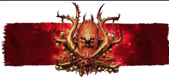
Icône de Khorne

Les unités Instables démoralisées sont immédiatement détruites. De plus, les unités Instables ne peuvent que contester les objectifs, pas les contrôler.