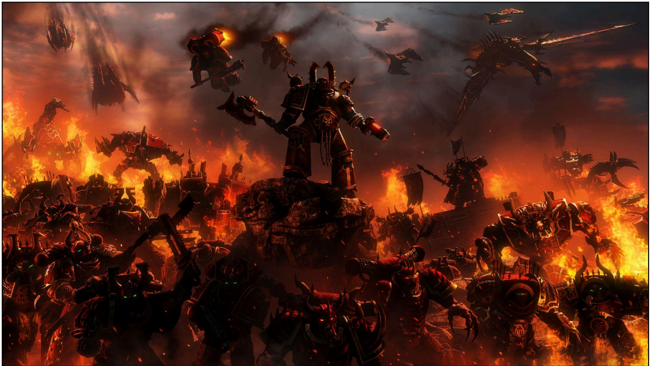
Legion World Eaters déferlant sur un monde impérial (date et lieu inconnus).

Si plusieurs formations utilisent des Modules d'atterrissage , placez tous les marqueurs Module d'atterrissage aux coordonnées prédéterminées en utilisant les règles d'Assaut Planétaire (y compris la résolution de dispersion). Une fois que tous les marqueurs sont placés, résolvez toutes les attaques des Modules d'atterrissage simultanément contre les formations ennemies à portée des marqueurs Module d'atterrissage . Les formations visées recevront un pion impact pour le tir pour chaque attaque du vaisseau ou des modules d'atterrissage. Les pertes et les tirs ruptures infligent des PI normalement. Puis débarquez toutes les formations transportées, en suivant les règles ci-dessus.