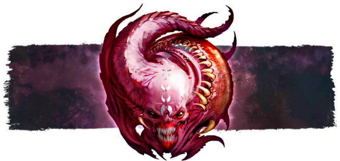
Icône de Slaanesh

Les unités Instables démoralisées sont immédiatement détruites. De plus, les unités Instables ne peuvent que contester les objectifs, pas les contrôler.